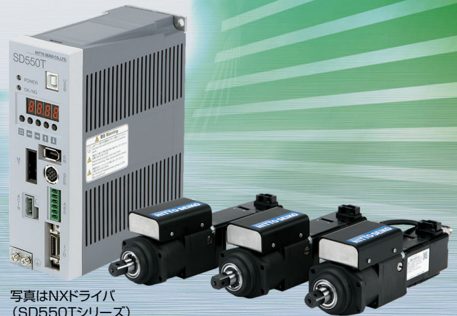
写真はNXドライバ (SD550Tシリーズ)