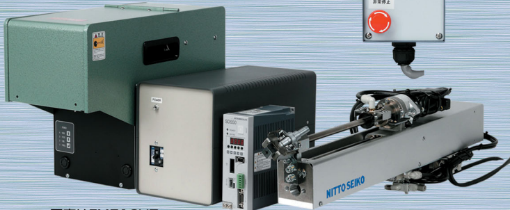
写真はFM513VZ ※操作BOXはオプション

真空発生装置や電磁弁もセット(タイプにより標準セット内容は異なります)で、システムへの組み込みが容易です。